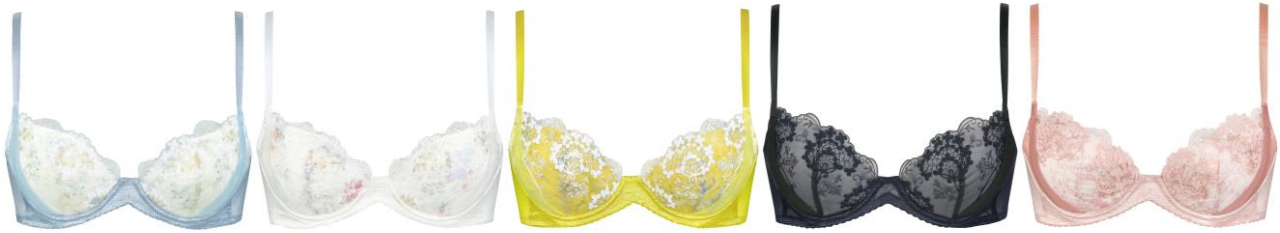
GB (グレイッシュブルー)