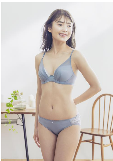
モデル着用商品『マッチミーブラ』 シンプルタイプ 品番：KB2011 カラー：GB

[マッチミーブラ] ウェブサイト URL https://www.w-wing.jp/matchme/index.html