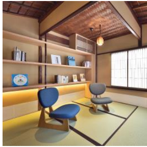
京の温所 御幸町夷川

キャンペーン URL： https://www.wacoal.jp/lasee/special/