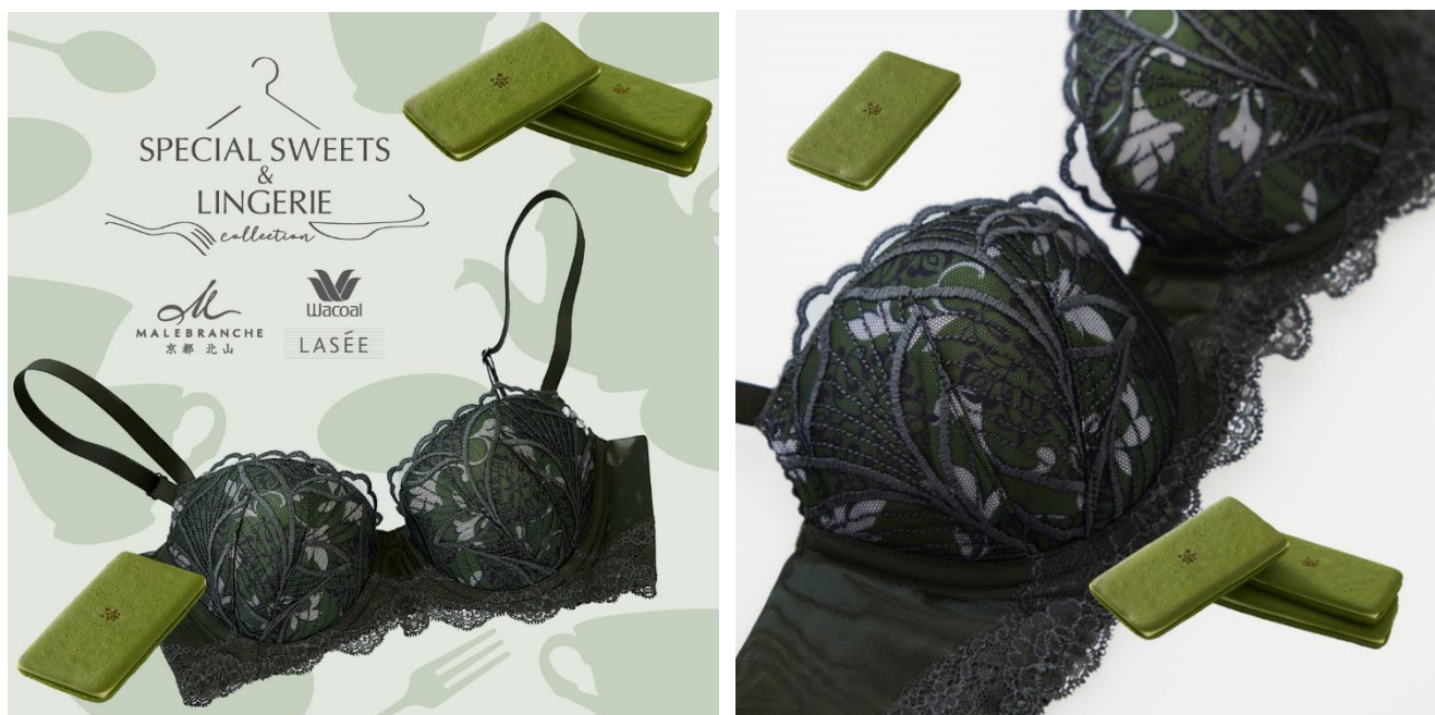
お濃茶ラングドシャ「茶の菓」をモチーフにしたブラジャー