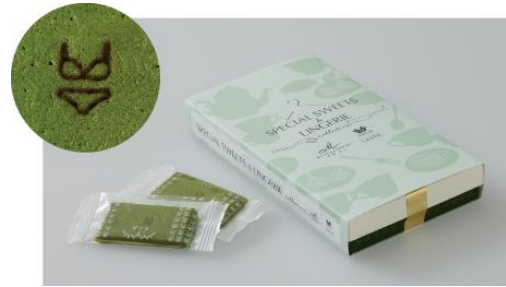
キャンペーンオリジナル「茶の菓」（非売品）