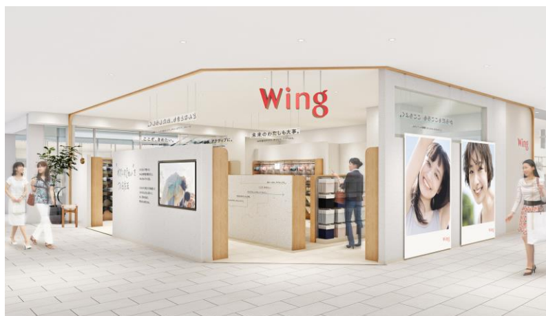
[ウイング 二子玉川店]