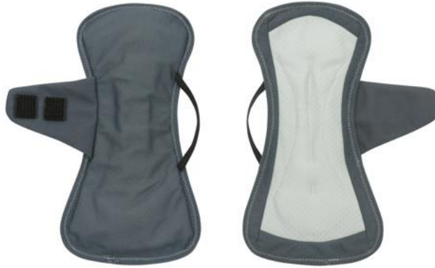
ワコール ショーツパッド (PPL001)