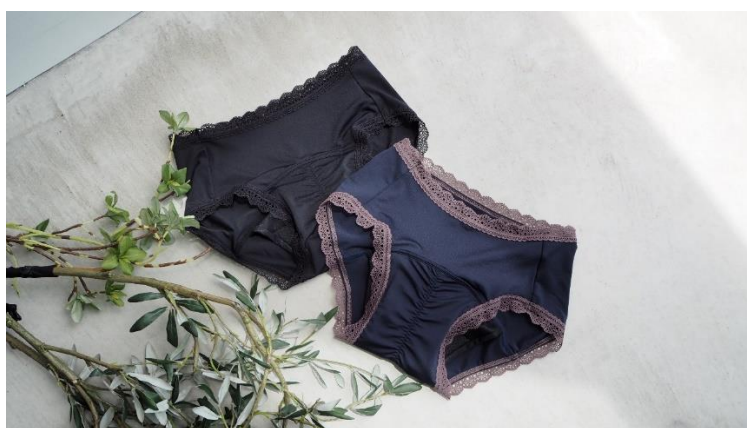
AMPHI/W'BASIC 吸水サニタリーショーツ (PFF020)