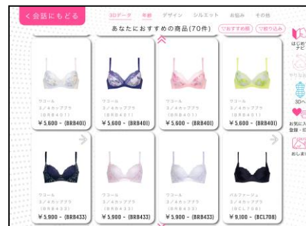
<接客 AI おすすめ商品>