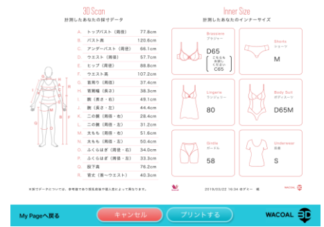
<計測データ・下着のサイズ>