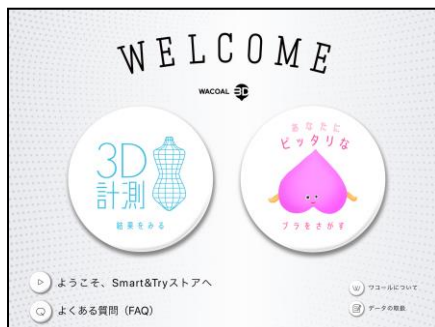
<接客 AI トップ画面>

また、からだの計測データやおすすめ商品、カウンセリングでお伺いした情報を、パーソナルシートとして発行することもできます。