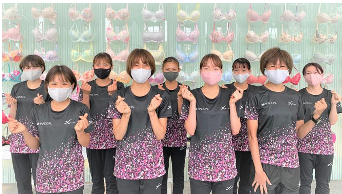
ワコール女子陸上競技部「スパークエンジェルス」も、「ピンクリボン活動」を応援しています！