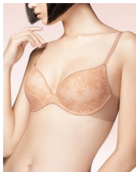
着用商品：『SUHADA』 BRB・461 PO(テラコッタオークル)