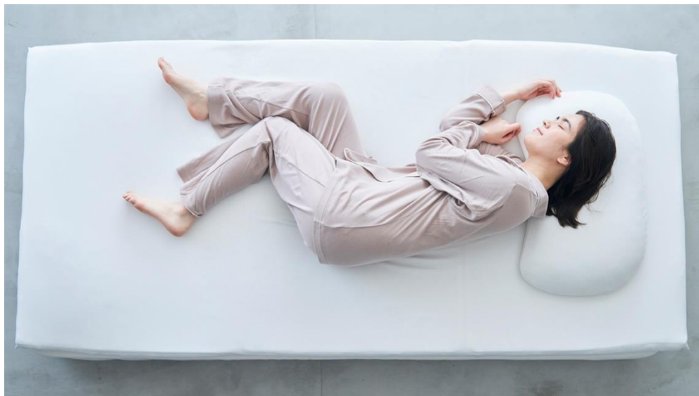
「ワコール 睡眠科学」 こちよくからだを支えるオーバーレイ 寄り添いフィット枕

なお、リブランドする「ワコール 睡眠科学」の全アイテムはワコールウェブストアにて、寝具を除くアイテムは全国の百貨店、専門店にて2023年2月より順次発売します。